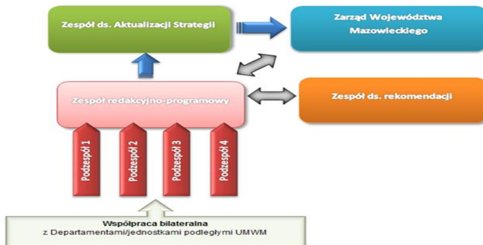
Rysunek 1. Schemat współpracy w ramach zespołów zadaniowych.

Wypracowany w podzespołach kształt Programu każdorazowo przekazywany został do uzgodnienia na ogólnym posiedzeniu Zespołu redakcyjno-programowego. Następnie ostateczne stanowisko przekazywano pod obrady Zespołu ds. Aktualizacji Strategii. Po uzyskaniu pozytywnego stanowiska, dokument był przekazywany na posiedzenie Zarządu Województwa Mazowieckiego.